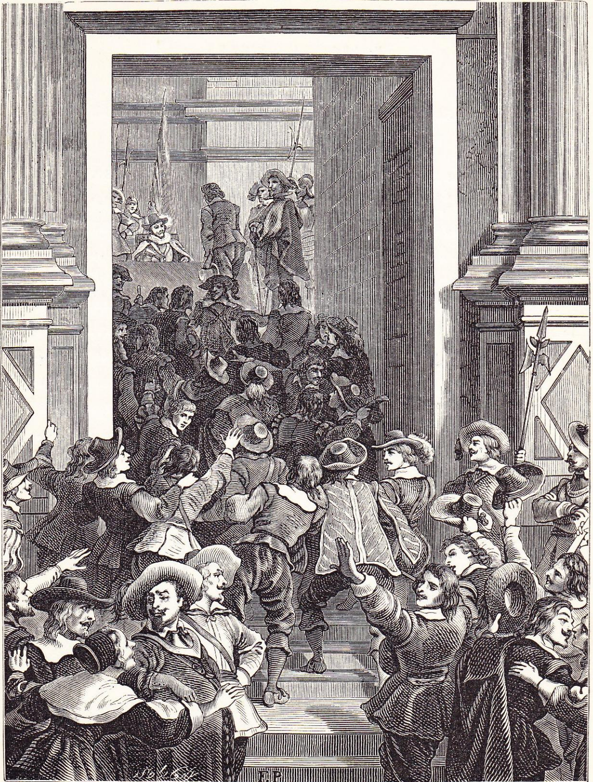
Enrôlements volontaires sous Louis XIII (1636).