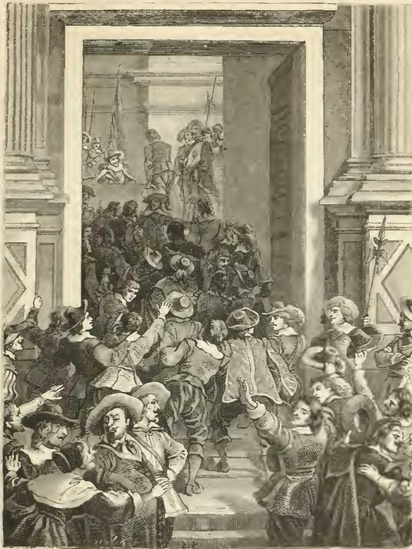
Les enrôlements à l'Hôtel de ville.

Les Hollandais menaçaient la Belgique. Les grandes villes picardes, dont les populations étaient fort braves, ne se montraient pas disposées à se rendre comme les petites. Le mouvement d'enrôlement était très-grand partout, et, dès le commencement de septembre, les Français eurent sur l'Oise près de quarante mille hommes.